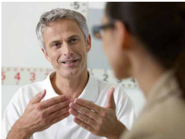
Abbildung Fa. ZEISS